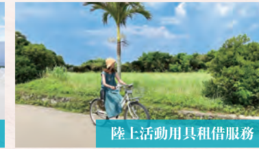
陸上活動用具租借服務